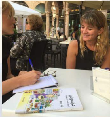
Didattica della lingua araba