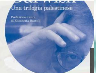
Romanzi poesie e traduzioni