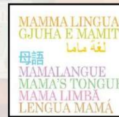
Sezione libri arabi di mamma lingua