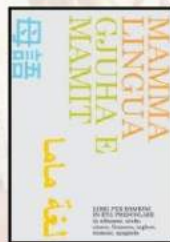
Catalogo intero di mamma lingua