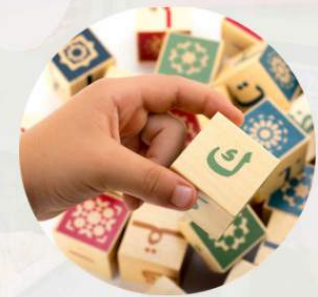
Giochi & gadget