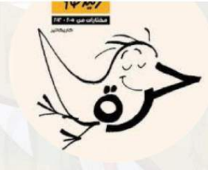
Libri per bambini & ragazzi