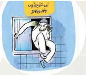
Novità e proposte