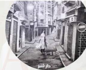
Fumetti e riviste