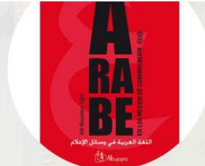
Libri per l'apprendimento e la didattica della lingua araba